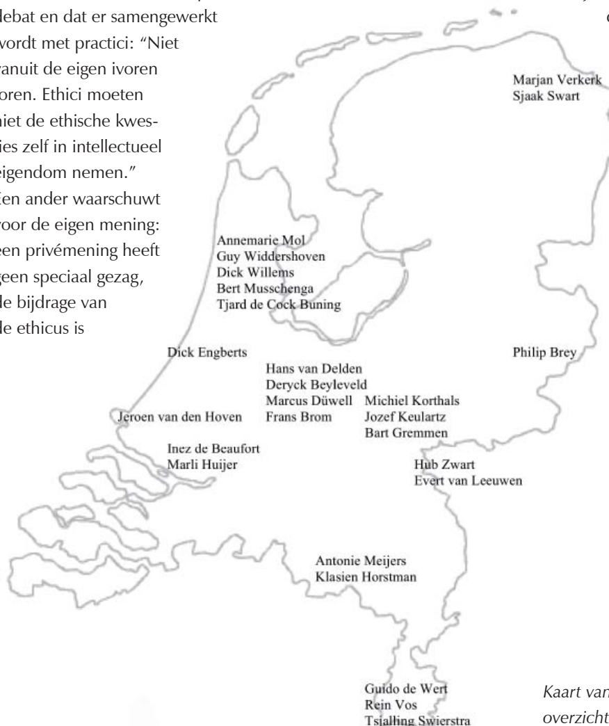
Kaart van Nederland met een voorlopig overzicht van professoren bio-ethiek

onderwerpen in te brengen wenselijk zou zijn. Sommigen zien graag meer duidelijkheid over de inhoud van de bio-ethiek. Ook mag de bio-ethiek ‘zwaarder’ en ‘meer volwassen’ worden en zich meer ontwikkelen als tak van de filosofie. In samenhang hiermee suggereert één respondent dat een debat over de verhouding tussen de medische faculteit en de filosofische faculteit gewenst is. We besluiten met de manier waarop één van de promovendi de toekomst zag: “Rooskleurig.”